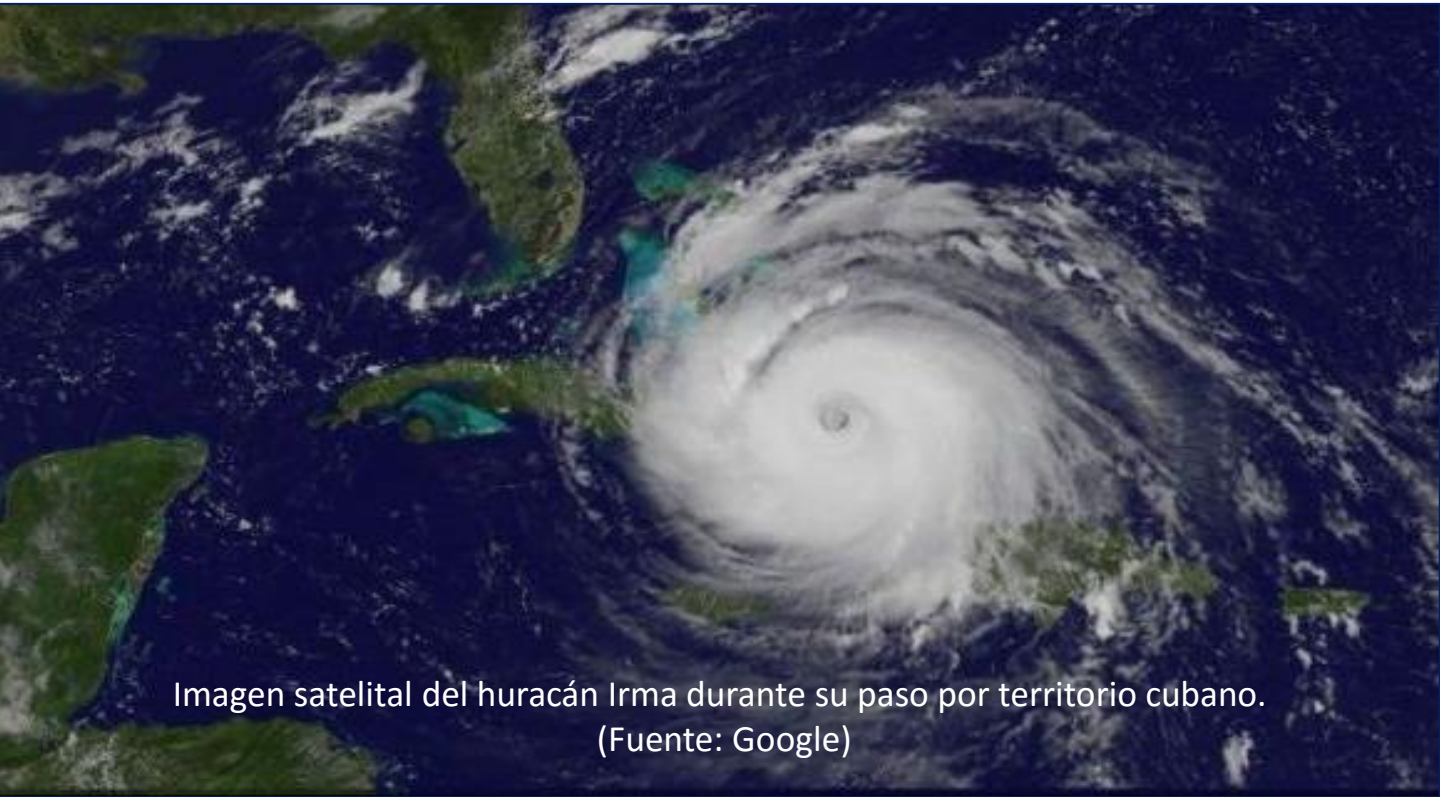
Imagen satelital del huracán Irma durante su paso por territorio cubano.