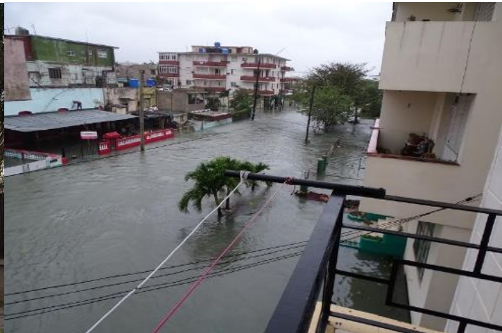
Izq.: Gigantesco árbol arrancado de raíz por la fuerza de los vientos, a escasos metros de la Embajada de Colombia. Der.: Penetración del mar en las calles del histórico Barrio El Vedado de La Habana.