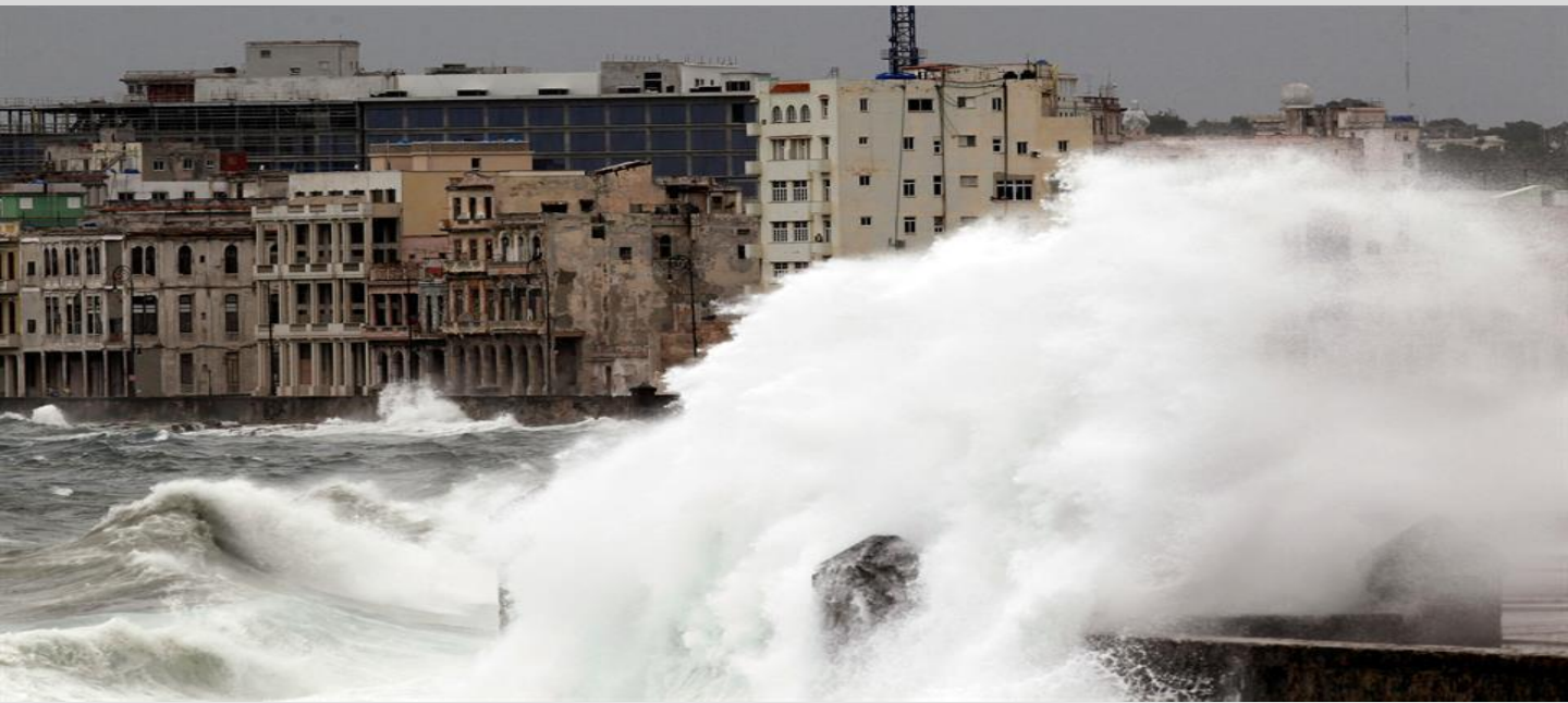
El Malecón de La Habana golpeado por olas hasta de 9 metros de altura. El mar penetró más de 500 metros, causando severas inundaciones.