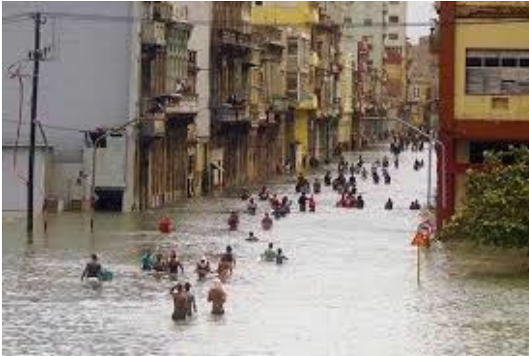
Calles de La Habana tras el paso de Irma

La Habana, Cuba (sep. 14/17). Del 8 al 10 de septiembre, Cuba resistió durante más de 72 horas los embates del que los expertos consideran el más poderoso fenómeno meteorológico que se ha formado en el Atlántico, que dejó a su paso desolación, muerte y destrucción en la mayor parte del territorio, al igual que en otras islas del Caribe y los Estados Unidos.