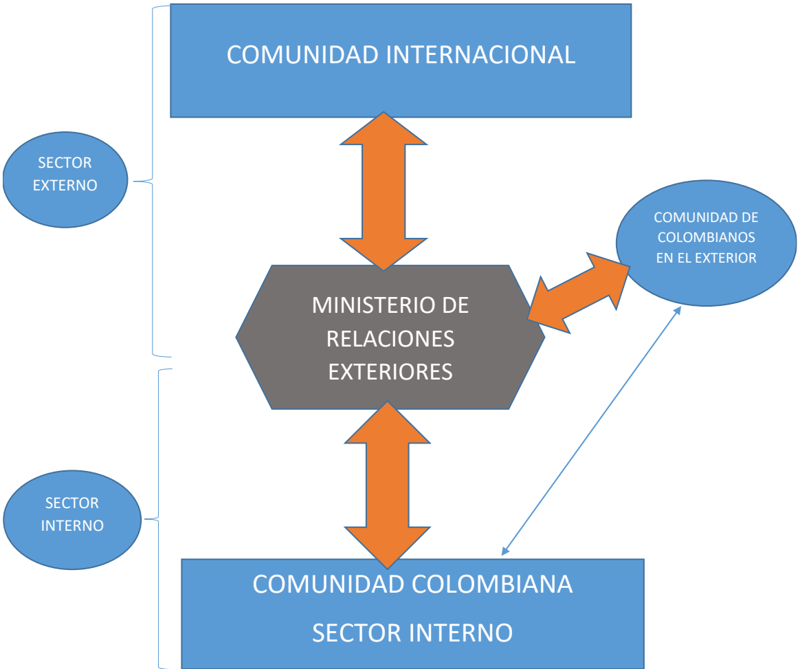
Figura 3. Flujograma ICO (Información, Comunicación y Oportunidades) bidireccional entre el Sector Externo y el Sector Interno