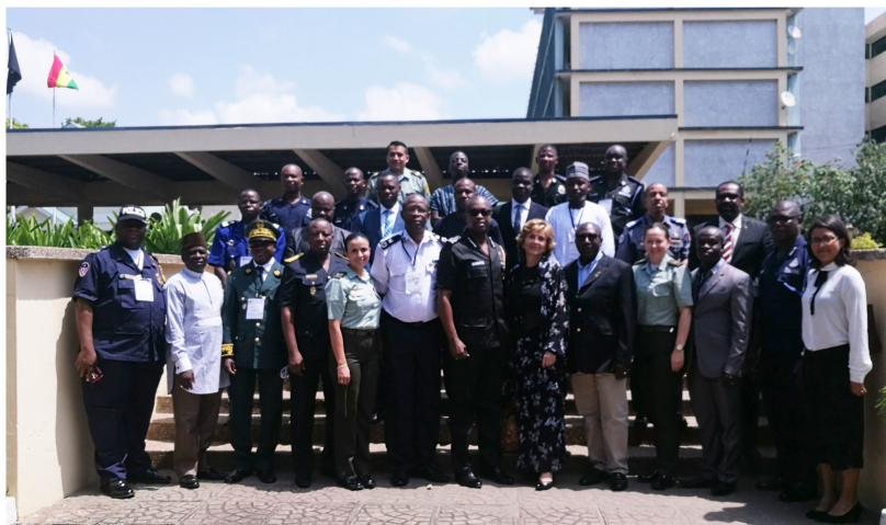
9 de junio de 2017. Los oficiales de África y Colombia visitan las instalaciones del Servicio de Policía Ghana.

Realizado en Accra (Ghana) del 5 al 9 de junio de 2017, Contó con la participación de 22 delegado de Policía de 10 países de África Occidental: Benin, Burkina Faso, Costa de Marfil, Ghana, Liberia, Nigeria, Senegal, Sierra Leona y Togo. Durante el seminario se intercambiaron experiencias en materia de lucha contra el problema mundial de las drogas, control de puertos y aeropuertos, inteligencia, y fortalecimiento institucional