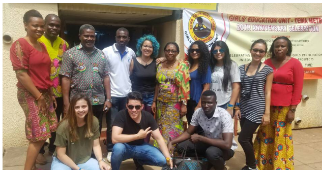
23 Septiembre. Visita de los jóvenes colombianos a la Unidad de Educación para niñas - TEMA (Ghana)

15 Jóvenes de Ghana, Liberia y Colombia realizaron un intercambio a doble vía, de experiencias y buenas prácticas en materia de liderazgo, trabajo en equipo, resolución de conflictos, y fortalecimiento de organizaciones juveniles, en sus respectivos países.