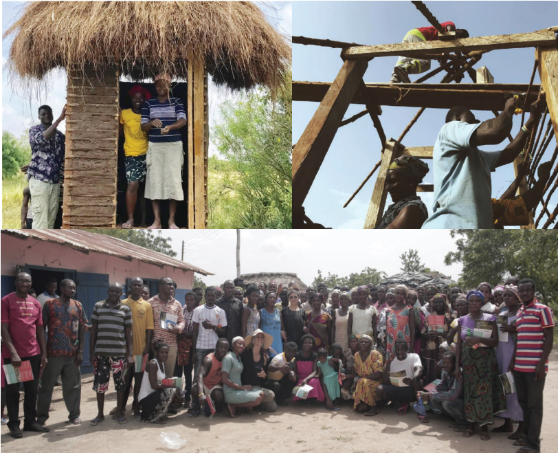
Construction process of Dry Toilets, Nyapenya Community.

Dry toilets, do not require piped water, use composting (aerobic fermentation) sawdust or other organic material, ideal for areas with scarce water resources, such as Shai Osudoku district, municipality of Dodwa, part of the greater Accra region (Ghana). Two experts from Organizmo Foundation worked together with 70 beneficiaries from the communities of James Town and Nyapenya, in November of 2017, through training in construction, and maintenance of dry toilets. This project is carried out in coordination between Organizmo, APC-Colombia, the Embassy of Colombia in Ghana, the Chancellery and the Global Network of Health and Demographic Surveillance Systems - INDEPTH.