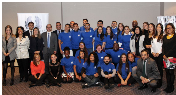
15 Septiembre. Despedida de los voluntarios a cargo de la Fundación Heart for Change, APC-Colombia y Cancillería