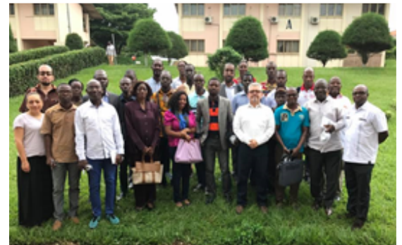
Delegation of Uniminuto, and IUTEA, in the future headquarters of the Institute, Côte d'Ivoire.

Project, "Transference of the Knowledge Model of the UniMinuto Integral Model of Higher Education", which served as the basis for the foundation of the Instituto Universitario Tecnológico Eudista - IUTEA. From October 16 to 21, 2017, the last mission led by Universidad Minuto de Dios in Cote d'Ivoire was developed. This activity was carried out in coordination between UniMinuto, APC-Colombia and the Ministry of Foreign Affairs of Colombia.