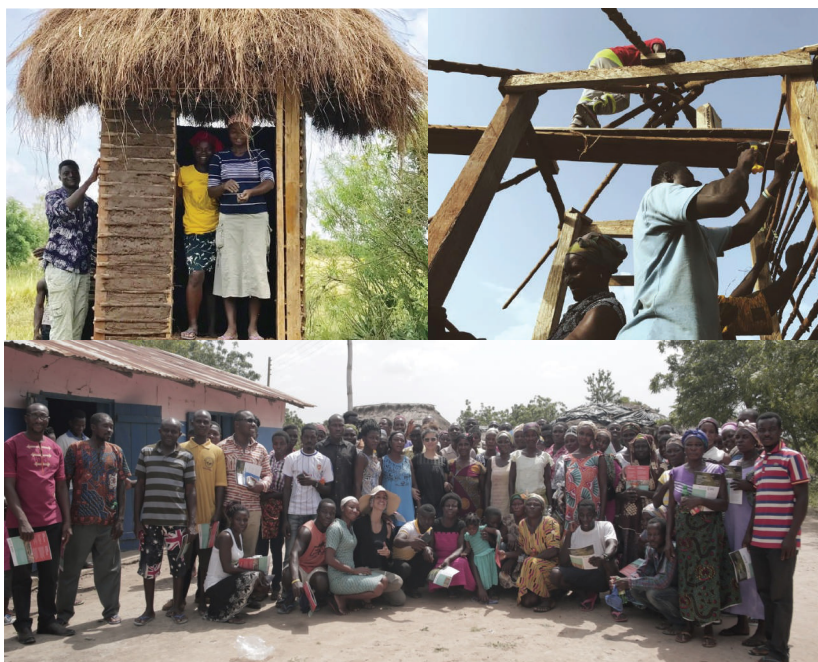
Proceso de construcción de Baños Secos, Comunidad Nyapenya.

Los baños secos, no requieren agua entubada, se valen del compostaje (fermentación aerobia) aserrín u otro material orgánico, ideales para zonas con escasez de recursos hídricos, como el distrito de Shai Osudoku, municipalidad de Dodwa, parte de la gran región de Accra (Ghana). Allí dos expertos de Organismo trabajaron conjuntamente con 70 beneficiarios de las comunidades de James Town y Nyapenya, en noviembre de 2017, a través de capacitaciones en construcción, y mantenimiento de baños secos. Este proyecto se realiza en coordinación entre Organismo, APC-Colombia, la Embajada de Colombia en Ghana, la Cancillería y la Red Global de Salud y Sistemas de Vigilancia Demográfica - INDEPTH.