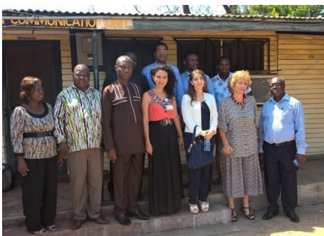
Mission of Colombia to Ghana and Benin. Exchange of knowledge in Banana, Cocoa and Coffee.