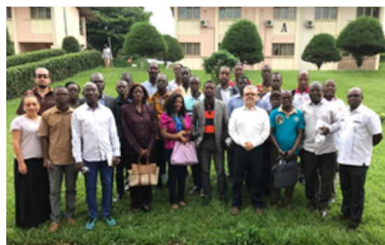
Delegación de la Uniminuto, y la IUTEA, en la futura sede del Instituto, Costa de Marfil.

Proyecto, "Trasferencia del Modelo de Conocimiento del modelo Integral de Educación Superior de la UniMinuto" el cual sirvió como base para la fundación del Instituto Universitario Tecnológico Eudista - IUTEA. Del 16 al 21 de octubre, 2017 se desarrolló la última misión liderada por la Universidad Minuto de Dios en Costa de Marfil. Esta actividad se realizó en coordinación entre la UniMinuto, APC-Colombia y la Cancillería de Colombia.