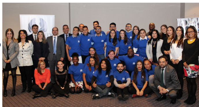
September 15 Farewell to the volunteers in charge of the Heart for Change Foundation, APC-Colombia and Chancellery