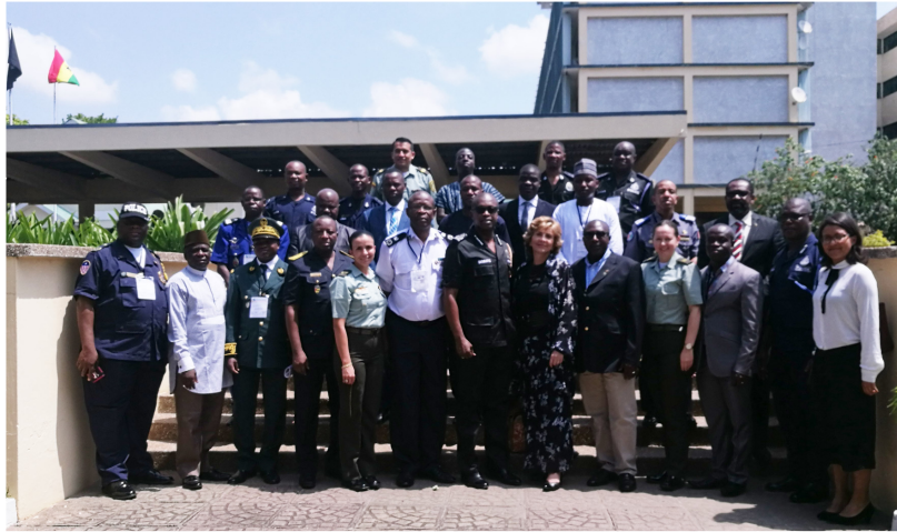
June 9, 2017. Officials from Africa and Colombia visit the headquarters of the Ghana Police Service.

Developed in Accra (Ghana) from June 5 to 9, 2017, it was attended by 22 Police Delegates from 10 West African countries: Benin, Burkina Faso, Cote d'Ivoire, Ghana, Liberia, Nigeria, Senegal, Sierra Leone and Togo. During the seminar experiences were exchanged in the fight against the global problem of drugs, control of ports and airports, intelligence, and institutional strengthening